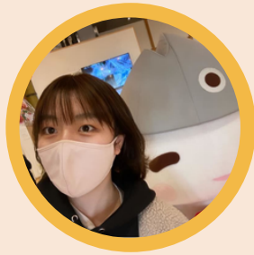
なごみ 研究者/大阪