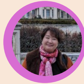
たまき 東京学芸大学